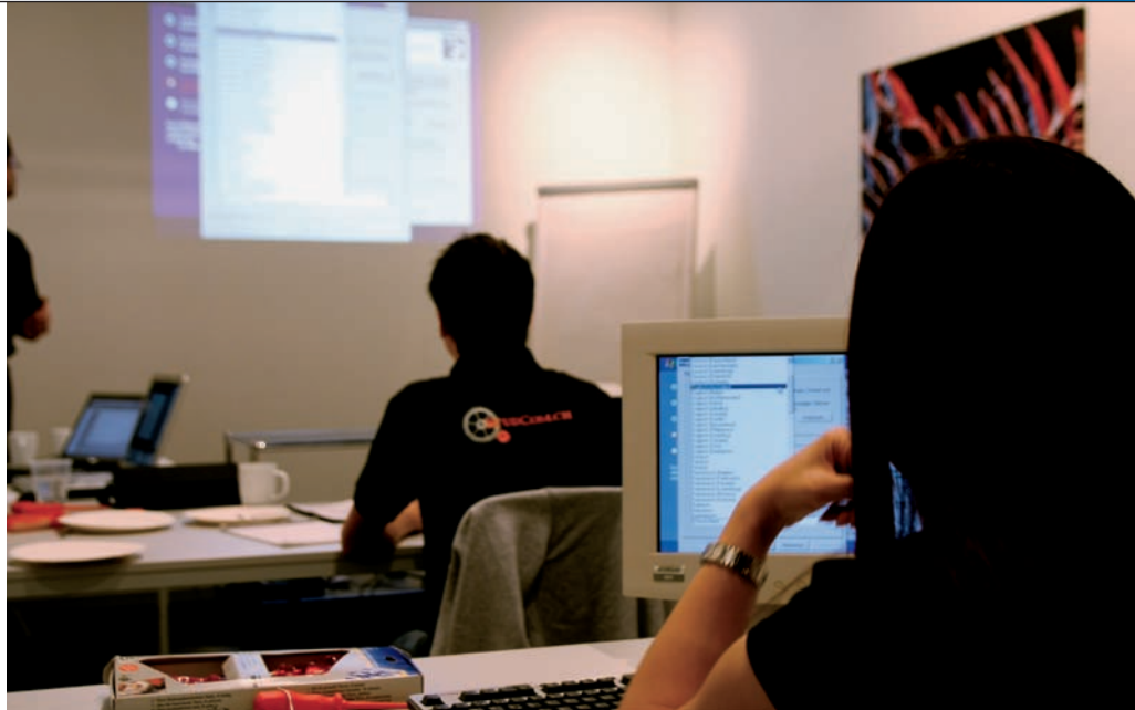
Die Schulungsräume bei StudCom

Die unter Webdesign fallenden Gebiete sind heutzutage weit gefächert und komplex. Durch das Studentenpoolkonzept, das vom frischen und topaktuellen Wissen der im Einsatz stehenden Studenten profitiert, kann StudCom bezüglich Webseiten und -applikationen nahezu alle Bereiche abdecken. So wird das Erstellen einer Webseite von A bis Z geplant und durchgeführt. Vom Design über die Konzeption bis hin zur Fertigstellung und Betreuung wird alles